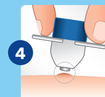
4. Aplique a ponta metálica na verruga comum durante 20 segundos ou na verruga plantar durante 40 segundos. Certifique-se de que a ponta metálica cobre a maior área possível da verruga comum ou plantar.