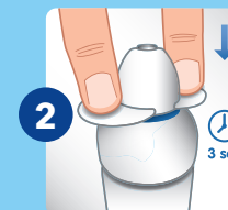
2. Coloque a embalagem aerossol sobre uma superfície rígida e pressione o atuador branco durante 3 segundos. A seguir, deixe a embalagem repousar durante 5 segundos. Tenha cuidado para não tocar na ponta metálica ao pressionar.